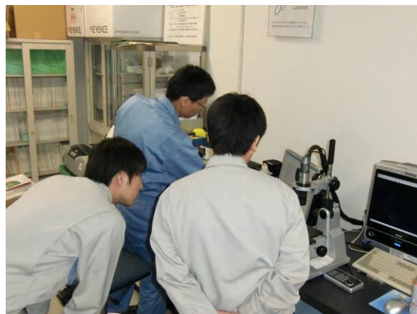
(実践的おためし測定、分析試験体験の様子)

一般の見学は、いつでもお受けしておりますので、下記の担当までお気軽にご連絡ください。