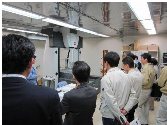
CNC 万能三次元測定機 見学風景

予定人員の2倍を上回る大盛況でした。また、質問も多く出され、見学会も好評でした。「さっそく使いたい」という声も何人かありました。