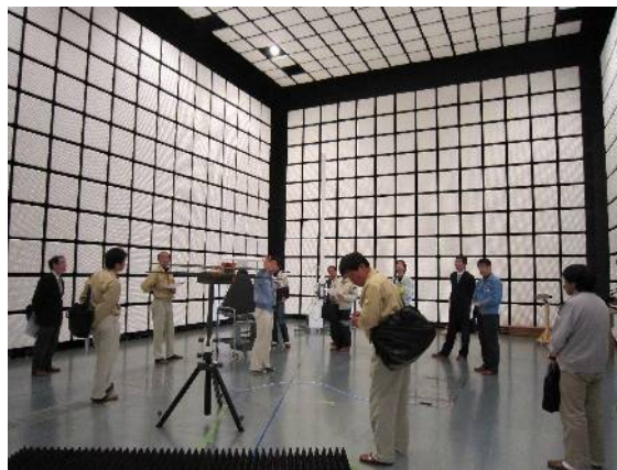
電波暗室 見学風景