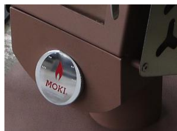
ユーシーエアコントロール