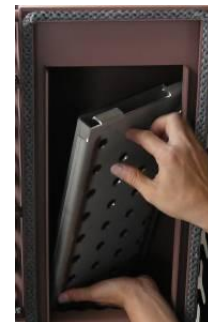
モキBOXプレート (メンテナンス時)