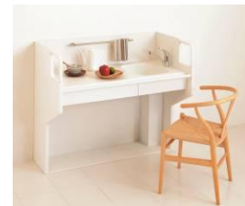
<らくすわミニ デスクスタイル>