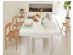
<たいらなベース・コミュニケーションスタイル>