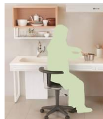
<たいらなベース・ワークスタイル>