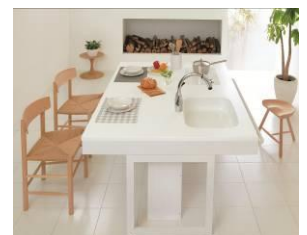
<たいらなベース・コミュニケーションスタイル>